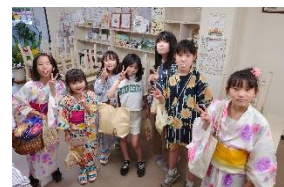
8月6日(日) ローソクもらい