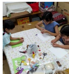
8月1日(火) フェルトキーホルダーづくり