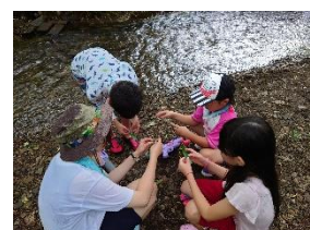
8月2日(水) 真駒内の裏山探検の川遊び